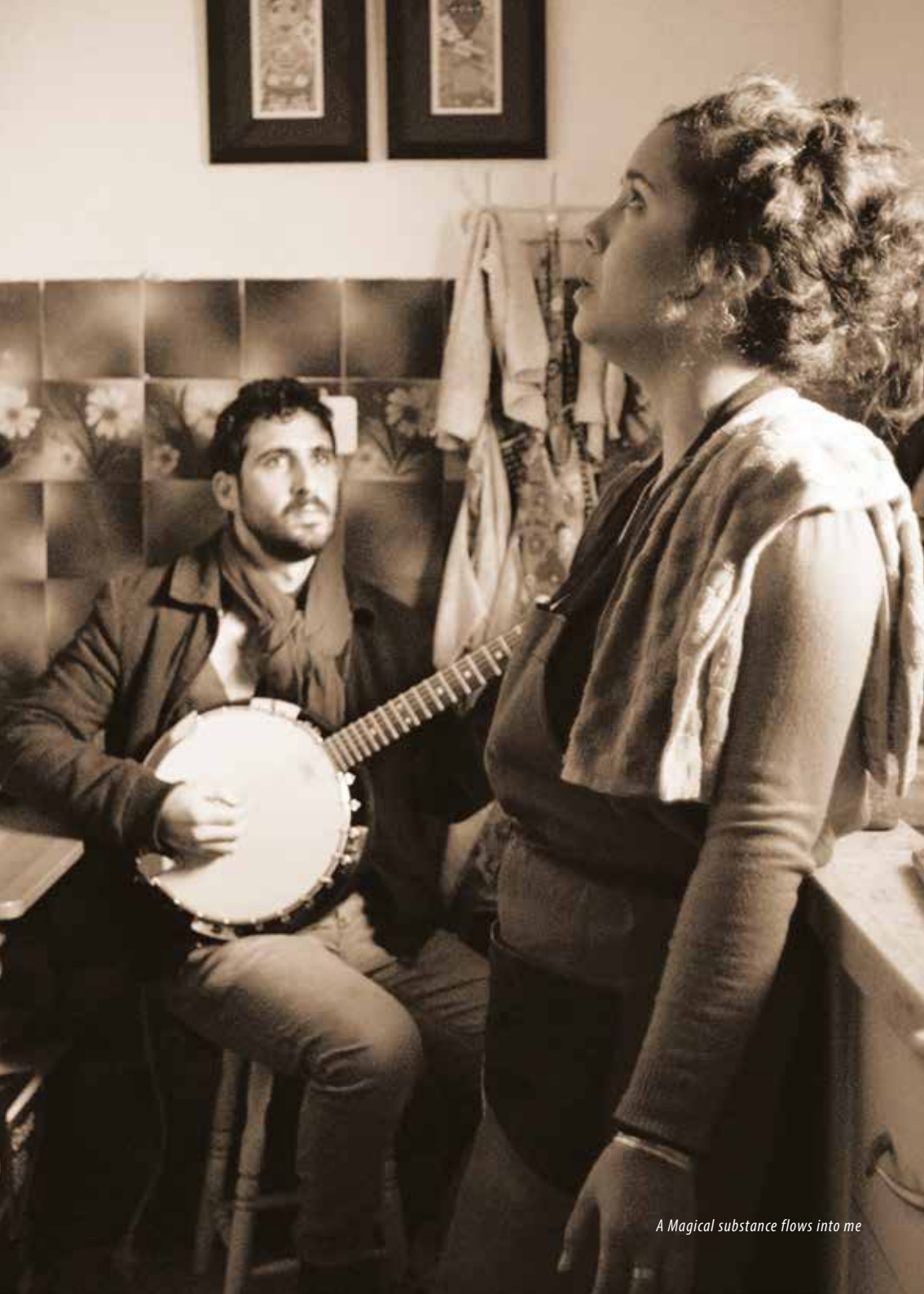
A Magical substance flows into me