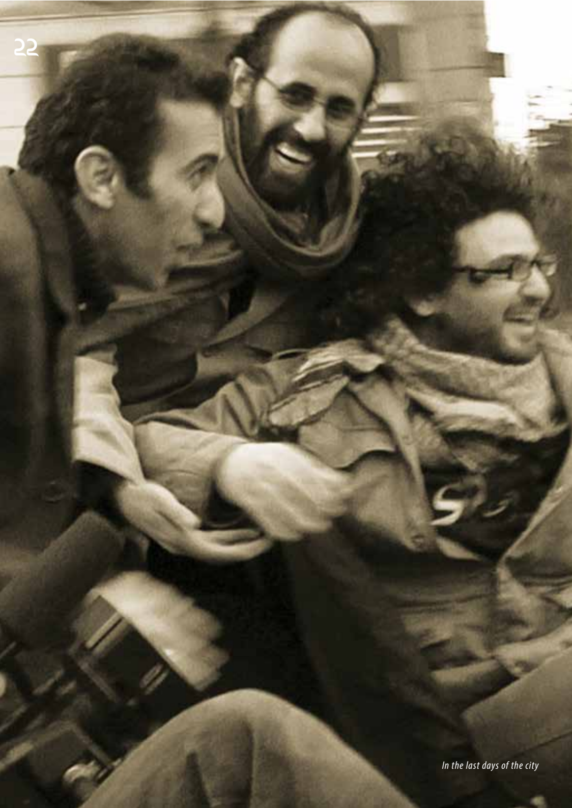
In the last days of the city